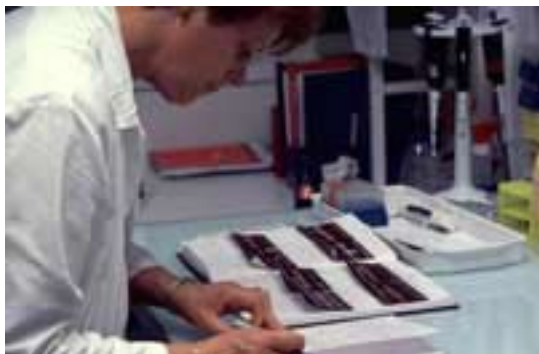
Genoscope, Laboratorio de investigación genética