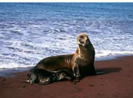
Galapagos islands, sea-lion and baby

Cinq jeunes spécialistes du patrimoine d'un peu partout dans le monde vont recevoir des bourses UNESCO-VOCATIONS PATRIMOINE qui leur permettront de poursuivre leurs recherches de troisième cycle à l'University College de Dublin (Irlande) et à l'Université technique du Brandebourg de Co-